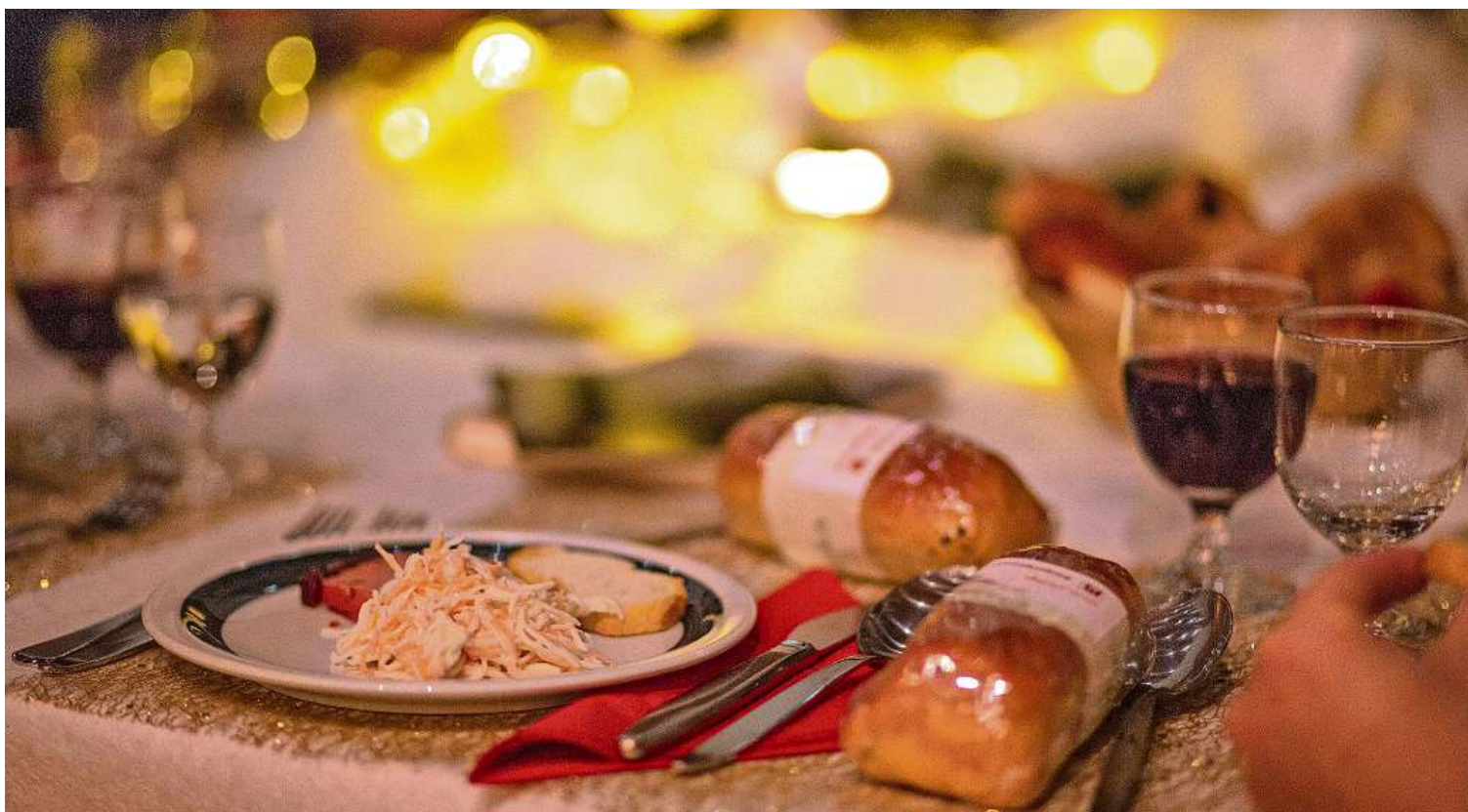
Gemeinsam statt einsam: Am 24. Dezember organisiert der Hilfsverein im Comandersaal eine Weihnachtsfeier für alle Interessierten.